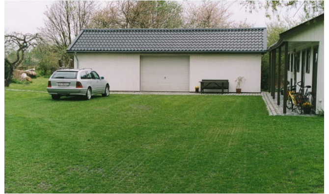
Nedsivning gennem græsarmering