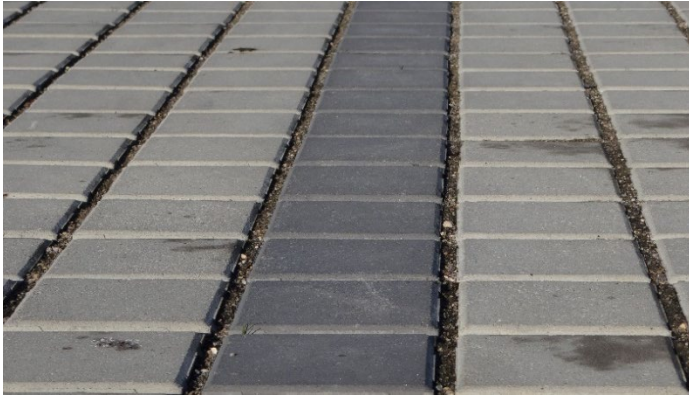
Nedsivning gennem fuger